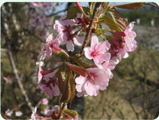
オオヤマザクラ(大山桜) ソメイヨシノに比べて花 の色が濃く葉色も赤い。

今でこそ日本人には特別な桜の花ですが、奈良時代までは花といえば梅でした。万葉集では圧倒的に梅を詠んだ句の方が多いのです。梅と桜が逆転するのは平安時代から。遣唐使が廃止されて国風文化が育つにつれて、桜が日本人に根付きました。春の訪れとともに満開になり数日で散ってしまう桜は「もののあはれ」の象徴です。西行法師が詠んだ「願はくは花の下にて春死なんそのきさらぎの望月のころ」は最も知られた桜の句ではないでしょうか。