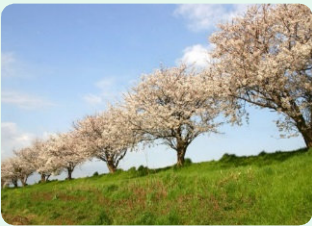
川岸に並ぶ桜が見られるようになったのは江戸時代から。

しかしこの頃の桜は日本古来のヤマザクラが主でした。貴族たちの間では野生の桜を求めて野山を巡る桜狩りがたしなまれました。現在のように公園や川辺に人工的に桜が植えられたのは江戸時代から。しかし美観のためというよりも、桜を植えることで見物客を呼び込み歩かせることによって地盤を踏み固めることが狙いだったといえますから、江戸幕府もちゃっかりしていますね。